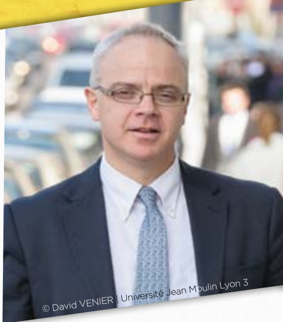
© David VENIER | Université Jean Moulin Lyon 3