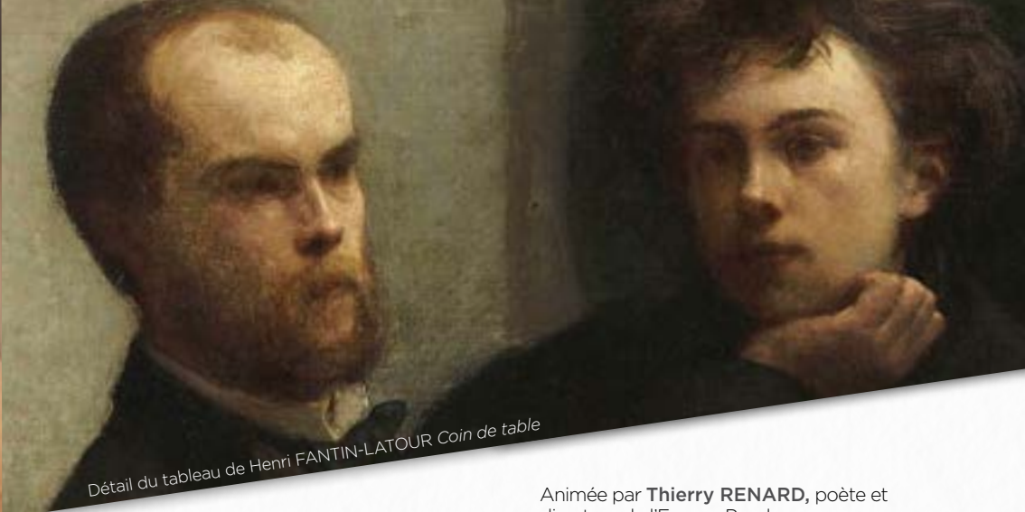
Détail du tableau de Henri FANTIN-LATOURE Coin de table