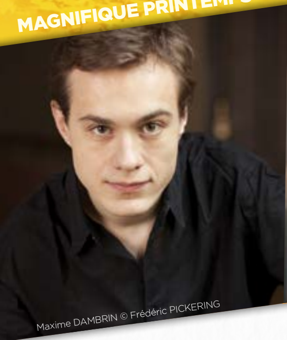
Maxime DAMBRIN