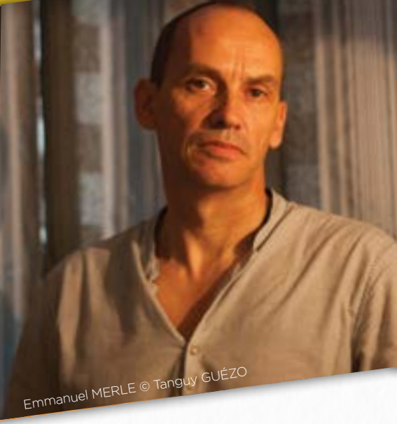
Emmanuel MERLE