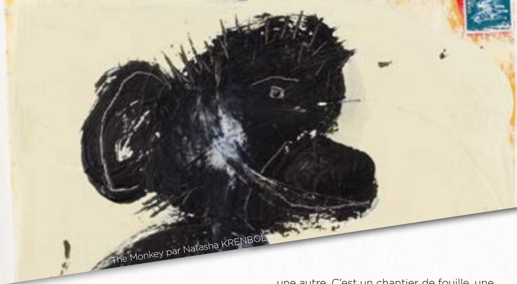
The Monkey par Natasha KRENBOL